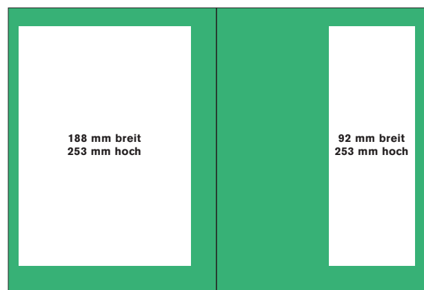
die ganze Seite, Satzspiegel